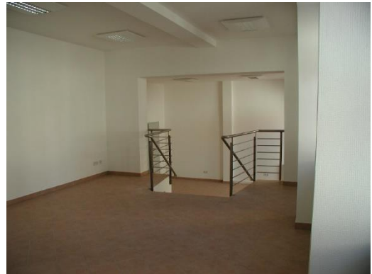
Innenaufnahmen / Archiv

Bei Vertragsabschluss ist eine Kautionshöhe der zweimaligen Grundmiete zu entrichten. Miete und Nebenkosten verstehen sich zzgl. MwSt.