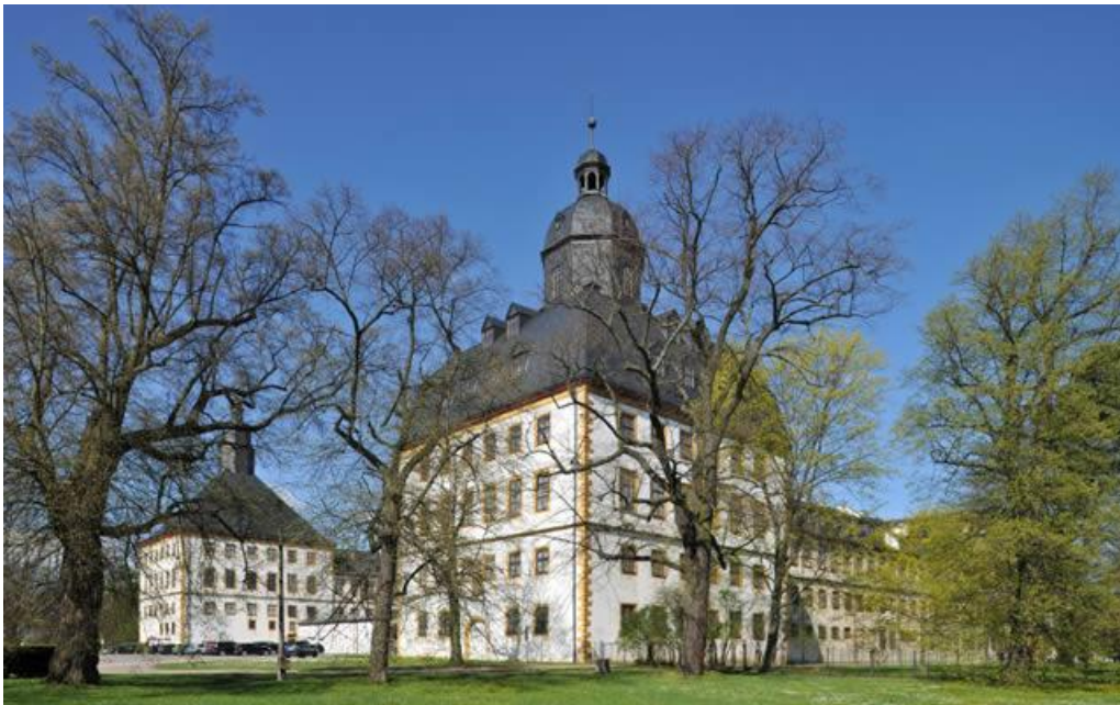
Schloss Friedenstein

Die Kreisstadt Gotha liegt mit ihrem Landkreis Gotha ziemlich genau im Mittelpunkt Deutschlands und erstreckt sich, eingebettet zwischen der Trügler Höhe, dem Boxberg und dem Kleinen Seeberg, auf einer Fläche von über 6.900 ha. Die Stadt gehört zur Vorlandregion des Thüringer Waldes und wird allgemein als "Westthüringer Berg- und Hügelland" vom eigentlichen Thüringer Becken ausgegliedert. Gotha ist besonders günstig an die überregionalen Verkehrsachsen gebunden.